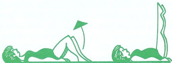
A. Pro časné fáze těhotenství, tj. do 6. měsíce

Tak, jak během těhotenství roste plod, dochází k oslabování a rozestupu přímých svalů břišních. Také se zpomaluje činnost střevní. Proto posilujte svaly stěny břišní, avšak vždy úměrně stupni gravidity.